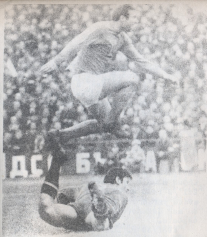
Първият в България с над 200 гола!

Бие добре познаваме някои от играчите на нашите гости. Какво е характерно за по-младите? Защитниците Да Силва и Адолфо са изключително здрави и бързи, а Адолфо е в състояние да тича безспирно от първата до последната минута. Централната двойка-защитници, стоперът Умберто и "либерото" Родригес имат отлична съгласуваност, но играят в линия и не са така "твърди". Родригес има великолепен удар и често /Филипов добре знае това/ шутира изкусно от далечни разстояния. Нене е "братовчед" на Еузебио, неговата родина е Мозамбик. Той е много бърз и пробивен, майстор на контра-атаката, която нък може често има навика да завършва, като своя предшественик Торес-голове с глава, с лив и десен крак.