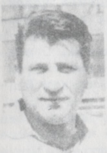
С МЪЖЕСТВО И БОЛТА БОЛТАТО СЕ ПОСИПГА