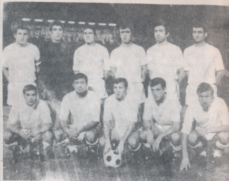
Тези които ни представих на стадион "Лус" в Лисабон