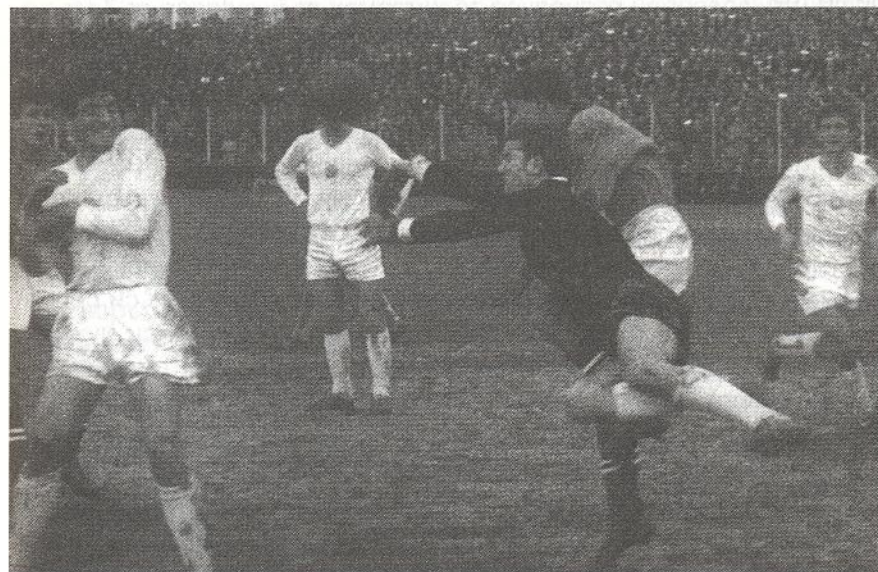
Югославия — България 1:1, гр. Сплит, 3.02.1963 г.

Така близко бяхме до победата, но не успяхме още веднъж да разтърсим мрежата на съперника. Завършихме наравно — 3:3. Според тогавашния правилник на УЕФА победителят се определяше чрез жребий и за наше нещастие за финала се класира Северна Ирландия. Ние с Шотландия трябваше да играем за третото място, но потиснати и отчаяни от несправедливостта ни беше вече все едно дали ще спечелим, или загубим. Пропуснахме възможността да се борим за първото място и покрусени се върнахме в родината. Жалко за победния ми гол в Пазарджик на 10 март с югославяните, жалко за отстраняването от групата ни на такива силни футболни отбори като Франция, Италия и Унгария, за решаващия ми гол срещу унгарците!