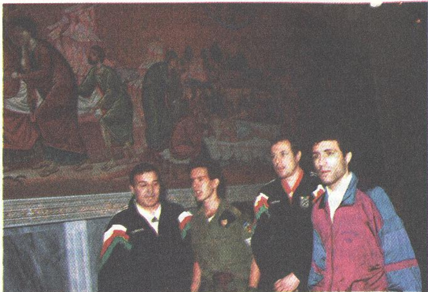
Ерусалим, на Божи гроб

брой точки, но с по-лоша голова разлика, Франция с 6 точки и Австрия с 2 точки.